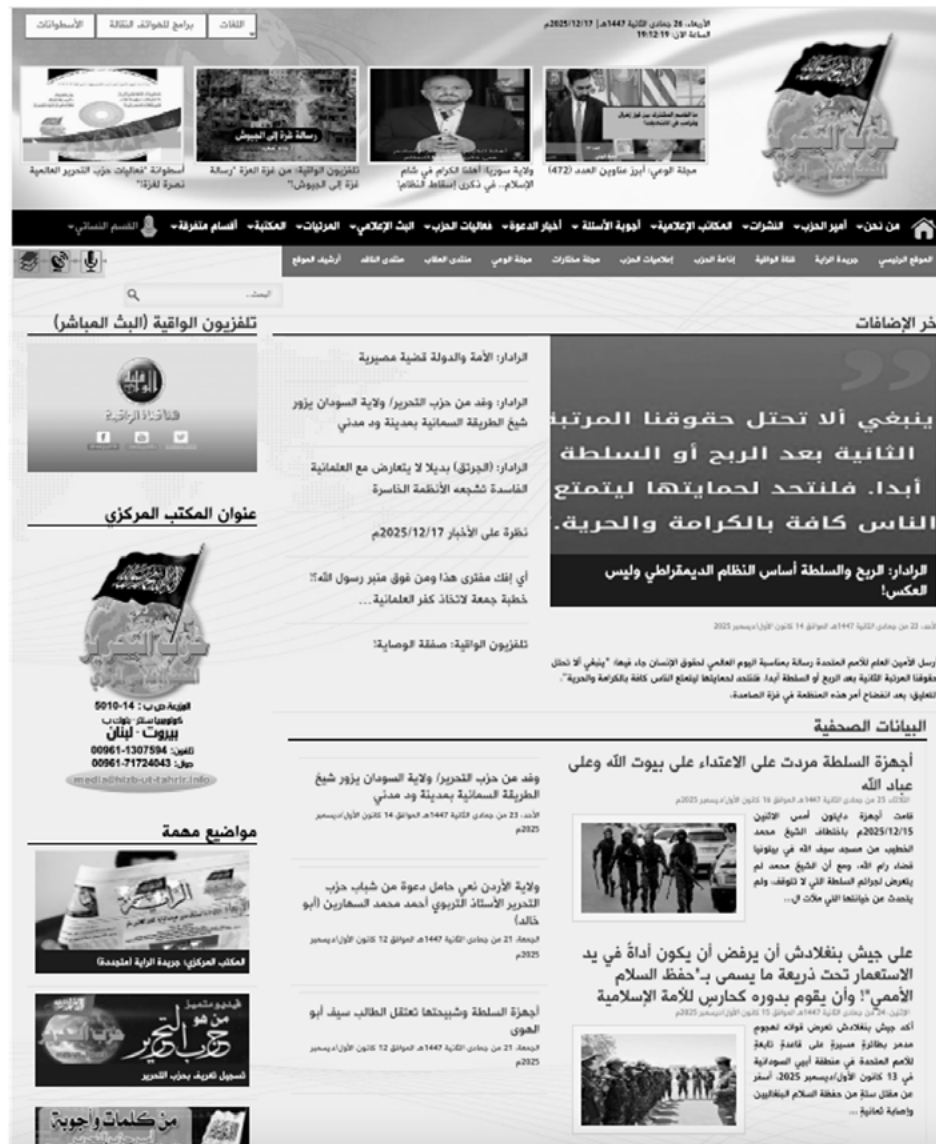
図1：解放党中央広報事務所のウェブサイト